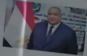
أ.د / سعيد عبد العزيز سرور

نائب رئيس الجامعة لشؤون خدمة المجتمع وتنمية البيئة