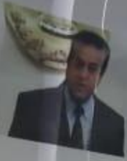
أ.د/ خالد عبد الفتاح وزير التعليم العالي والبحث العلمى