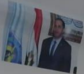
أ.د/ محمد صالح رئيس جامعة دمنهور