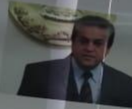
أ.د / خالد عبد الغفار