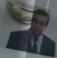
د. خالد عبد الفتاح وزير التعليم العالي والبحث العلمي