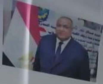
أ.د/ سعيد عبد الخفى سرور نائب رئيس الجامعة لشئون خدمة المجتمع وتنمية البيئة