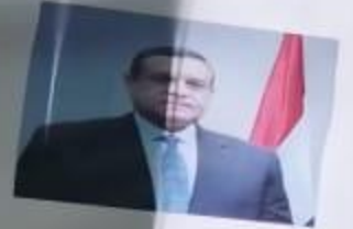
السيد اللواء أ.ح / هشام أمينه