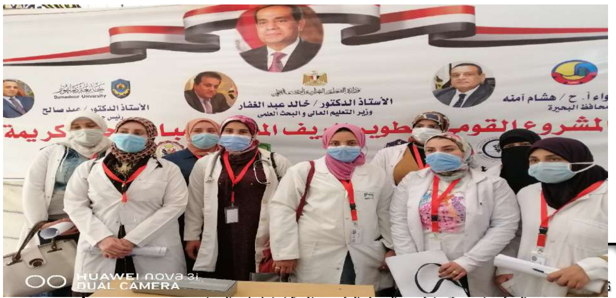
العمل وتسهم في تطوير البحث العلمي وتلبية احتياجات المجتمع